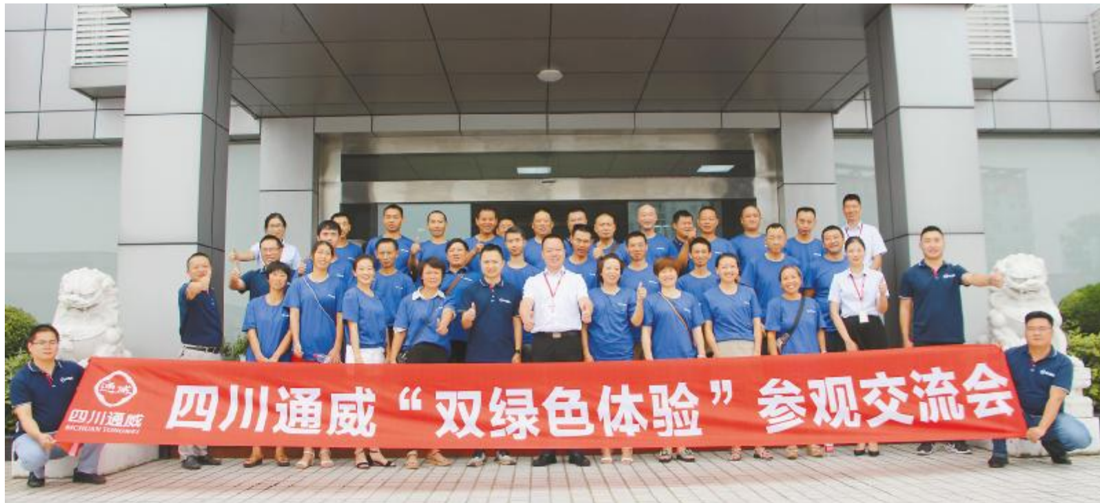
客户为华西片区四川通威“双绿色体验”交流会点赞