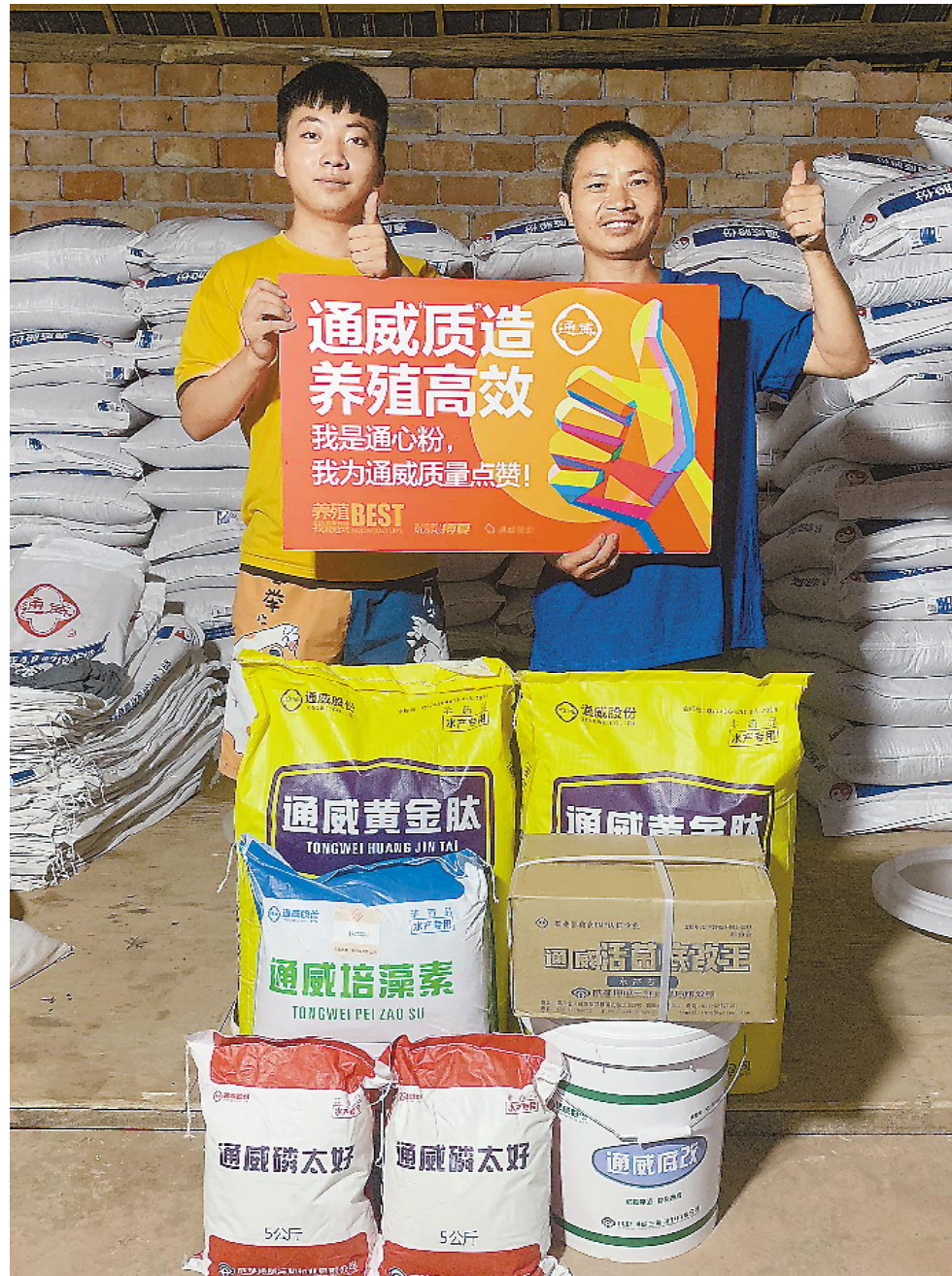
为优秀养殖户颁奖