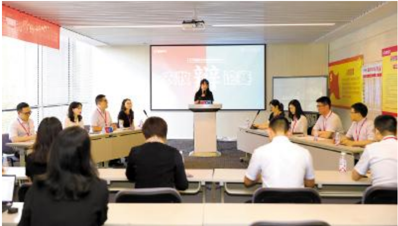
通威农牧第二期“聚焦执行力”辩论赛现场

当然,这是答案之一,不是唯一。我们可能很难复制别人的优秀,但一定要试图成为更优秀的自己。无论是执行意愿,还是执行能力,只要自己还是一个有进取心的执行者,总得有一项需要在提升的路上。