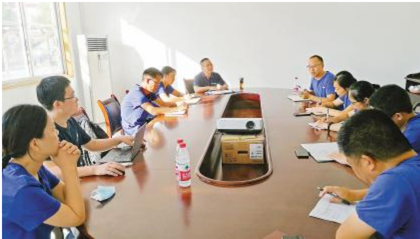
长春通威管理团队早会期间落实标准化项目进度