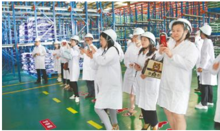
参训企业文化专员参观标准化打造试点公司

成都通威动物营养公司组织公司后勤体系开展以“提升标准化建设,营造良好生活环境”为主题的企业文化沙龙活动,围绕宿舍物品摆放、用电安全、清洁卫生标准等方面进行讨论,并形成解决方案,把标准化工作向纵深推进。厦门通威召开