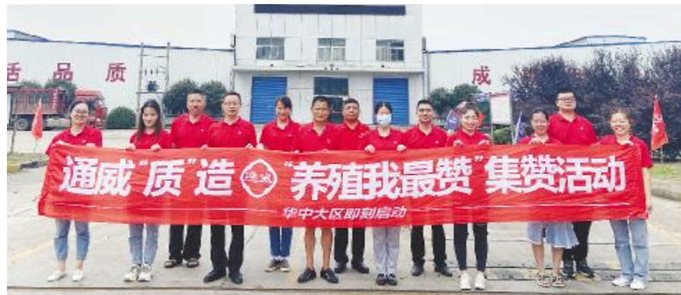
华中大区全面启动项目,回馈终端养殖户