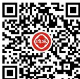
获取更多活动信息,请扫二维码

2019年,通威实现了自成立以来的销量最大增长——增量50万吨,相当于再造一个大型水产饲料生产企业!2020年上半年,通威在新冠肺炎疫情的压力下,第一时间复工复产,上半年销量增长远超行业平均水平!通威将继续保持强劲势头,朝着更高的挑战目标奋勇前行!