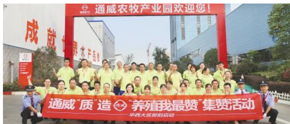
华西大区鼓励通威用户反馈产品效果、讲述养殖故事、比拼养殖技能