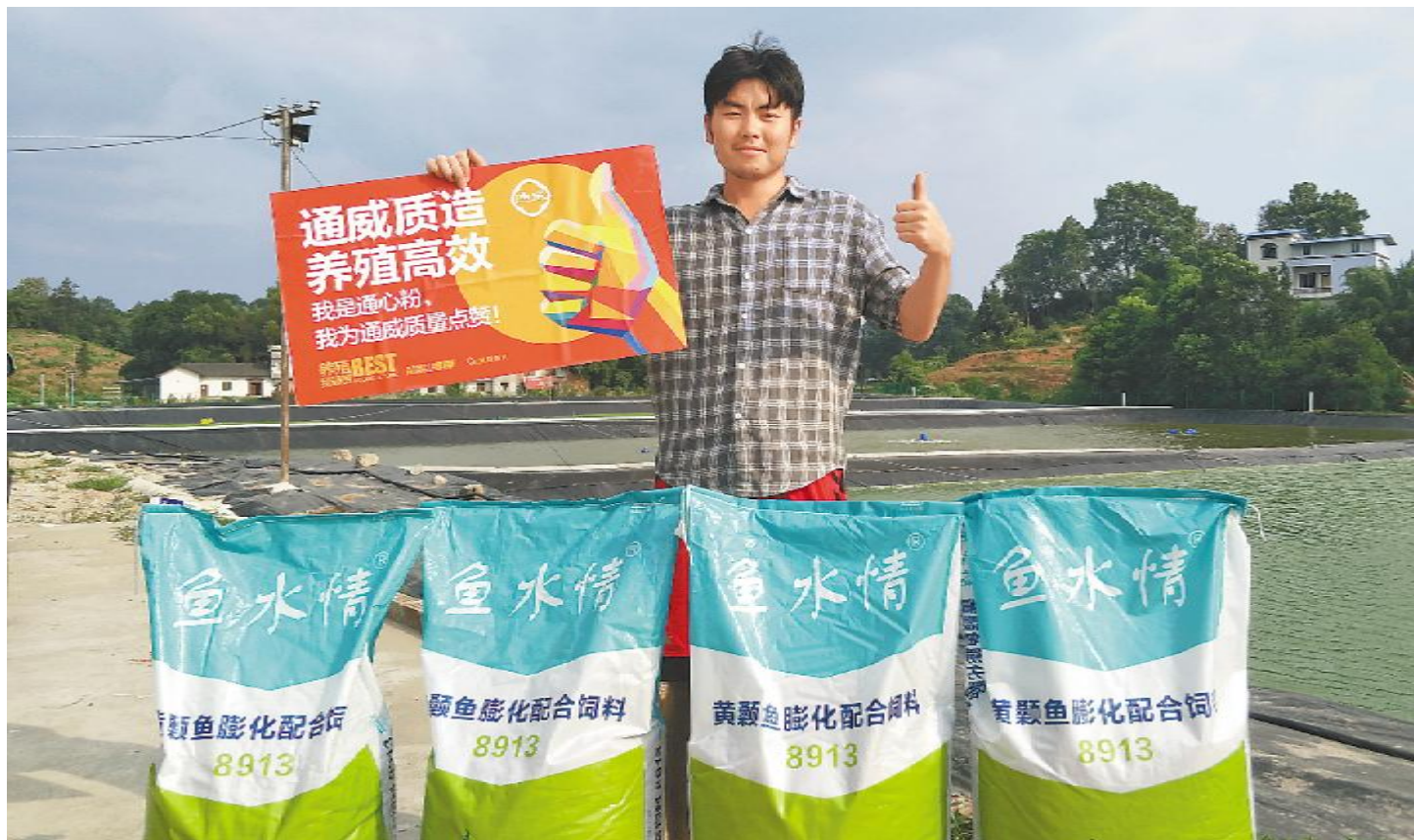
参与活动的养殖户为通威点赞

7月至9月,通威通过事件营销与故事营销持续制造舆论话题,而通威真正的实力,将在10月用效益见分晓。第三轮“超级通心粉”活动,10大战区将各推荐超级通心粉候选人,比拼养殖技巧及效益,由总部市场部选拔人员组成专家团,鱼塘调研、现场评选,最终遴选10名超级通心粉,邀请其前往成都总部参与“通心粉之夜”颁奖盛典,各赠予奖金5万元。用户,始终是产品品质、模式效益的最佳代言人,敬请期待10位超级通心粉脱颖而出。