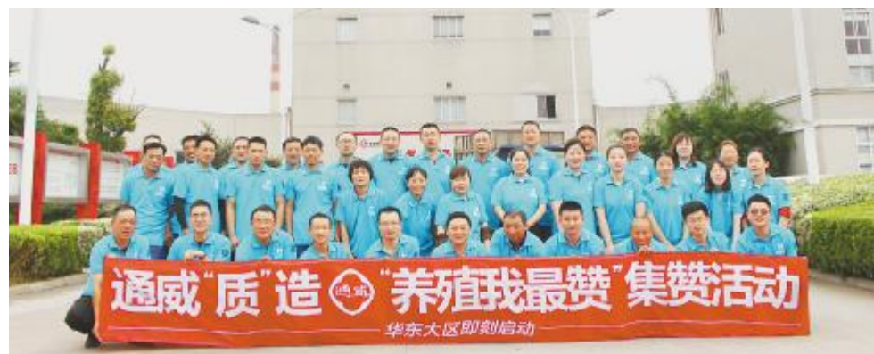
华东大区一线将士组织养殖户“晒数据、比效益、赢大奖”