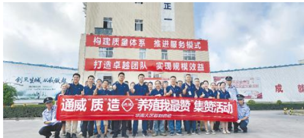
华南大区营销将士积极参与活动,助力“养殖效益最大化”