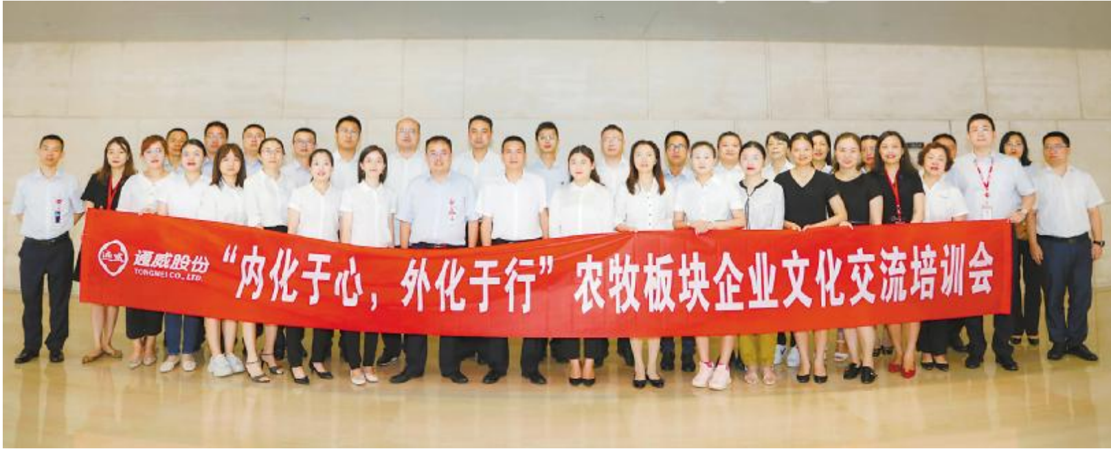
通威农牧企业文化培训交流会合影